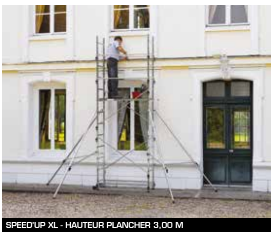
SPEED'UP XL - HAUTEUR PLANCHER 3,00 M