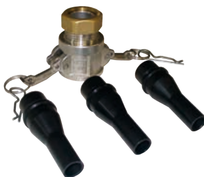
Kit rejointoiment 1 adaptateur + 3 buses à jointer Ø 10, Ø 12 et Ø 14