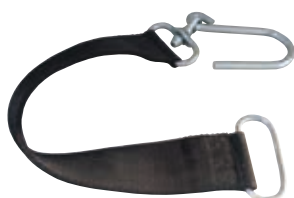
Sangle de support tuyau P 603