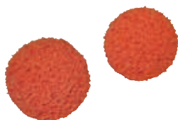
Balles de nettoyage 2 balles de nettoyage P 600