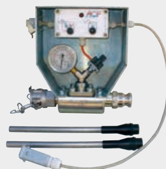
Kit "Spécial Injection" P 737