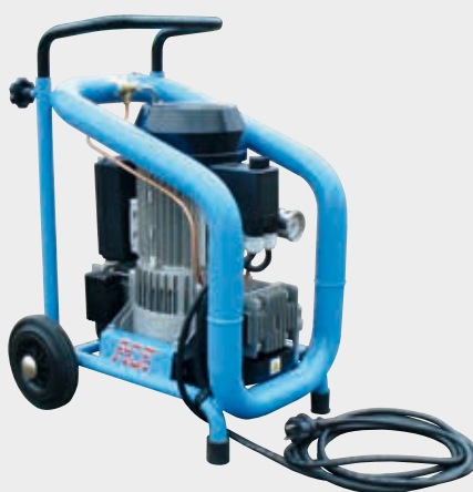
Compresseur d'air 200 l/mn N 001