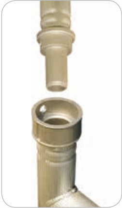
Jonction en fonte d'aluminium avec goupille

BASE : 112x230 cm STRUCTURE : 111x227 cm PLATEAU : 97x210 cm