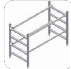
Ensemble terminal 4 échelons (Réf. C5-1122)