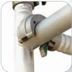
Verrouillage automatique très rapide des lisses et diagonales