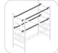
Protections horizontales pour plateau (Réf. C134-1122)