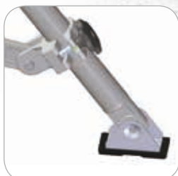
Stabilisateurs avec patins articulés antidérapants. Acier + Caoutchouc