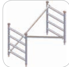
Ensemble rehausse 4 échelons (Réf. C3-1122)